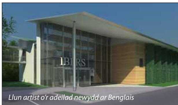
Llun artist o'r adeilad newydd ar Benglais

Yn ogystal, bydd yn ganolbwynt i Sefydliad Rhyngwladol newydd mewn Bridio