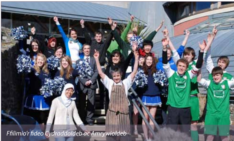
Ffilmio'r fideo Cydraddoldeb ac Amrywioldeb

Gyda mwy na 8,500 o fyfyrwyr a 2,000 o staff o dros 100 o wledydd ar draws y byd, ddylai hi ddim bod yn syndod fod Prifysgol Aberystwyth yn gartref i gymuned gyfoethog ac amrywiol.