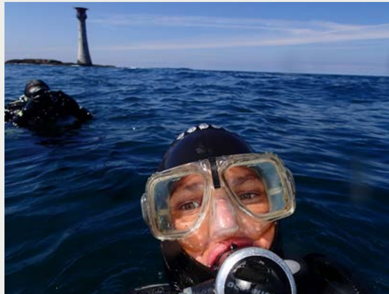
Uchod: Kerry yng Ngoleudy The Smalls , 20 milltir i'r gortlewin o Benrhyn Marloes yn Sir Benfro