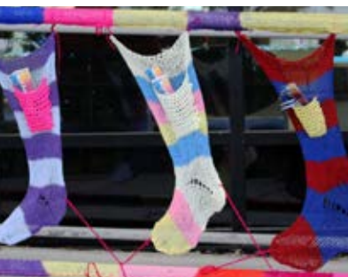
Siriolodd yr arddangosfa liwgar y tu allan i Lyfrgell Hugh Owen y Nadolig gyda chyfuniad o edafedd, goleuadau a chlychau.