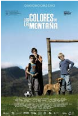
The Colors of the Mountain , rhan o Wyl Ffilm Cymru a'r Byd