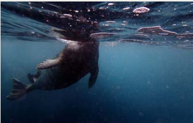
Isod: Ffotograff Kerry o forlo busneslyd gyda chwyn ar ei drwyn a dderbyniodd ganmoliaeth yng nghystadleuaeth ffotograffau Great British Diving y BSAC.

Pan oeddwn yn plymio sylwais ar bysgodyn digrif ei olwg nad oedd yn union yr un fath â'r Tompot Blenny holl bresennol a ffotogenic. Llwyddais i dynnu llun ohono ac fe gadarnhawyd yn ddiweddarach mai Red Blenny oedd y pysgodyn ac mai dyma'r tro cyntaf i'r rhywogaeth gael ei chofnodi yn nyfroedd Cymru.