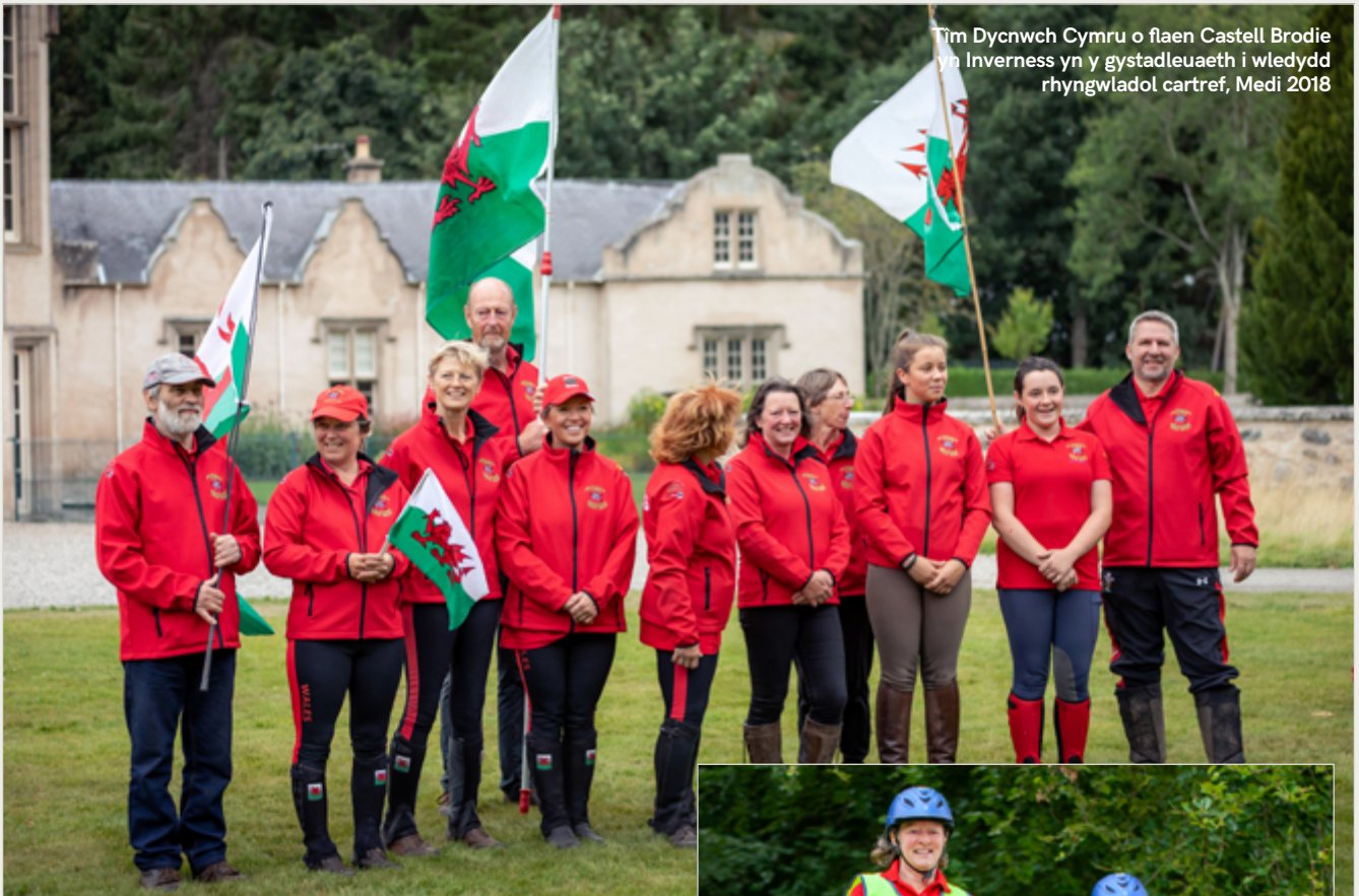
Tîm Dyncwch Cymru o flaen Castell Brodie yn Inverness yn y gystadleuaeth i wledydd rhyngwladol cartref, Medi 2018