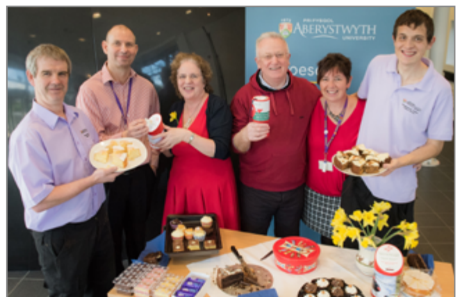
Cododd y Stodin Gacennau a gynhaliwyd gan Swyddfa'r Is-Ganghellor £230.