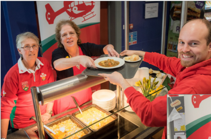
Gwnaeth yr Is-Ganghellor weini bwyd yn TaMed Da ar Ddiwrnod Gwisgo Coch.