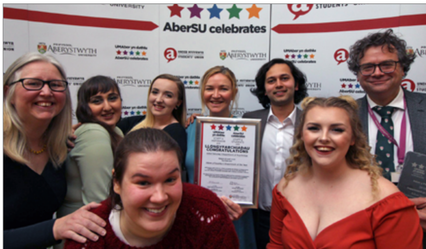
Aelodau'r Adran Seicoleg, a enillodd Adran y Flwyddyn 2019

Mae'r gwobrau yn gyfle i gydnabod a gwobrwyo staff a myfyrwyr, ac maent wedi'u harwain gan fyfyrwyr drwy'r holl broses o enwebu eu cyfoedion neu staff, i gyflwyno'r gwobrau yn y seremoni. Roedd yn anrhydedd cael bod yn rhan o'r digwyddiad a gweld y gwaith caled sy'n cael ei wneud gan bobl yn y Brifysgol."