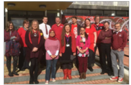
Gwisgodd staff o'r adrannau Mathemateg, Ffiseg a Chyfrifiadureg goch a phrynu cacennau cri, gan godi £64.