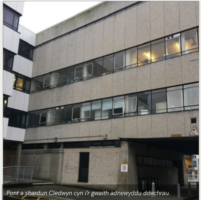
Pont a sbardun Cledwyn cyn i'r gwaith adnewyddu ddechrau.

Mae'r gwaith cyfalaf yn canolbwyntio'n bennaf ar adeiladau, megis adnewyddu concrit, toeau a ffenestri, ond yn cymryd y cyfle hefyd, lle bo'n bosibl, i edrych ar waith mwy sylweddol yn