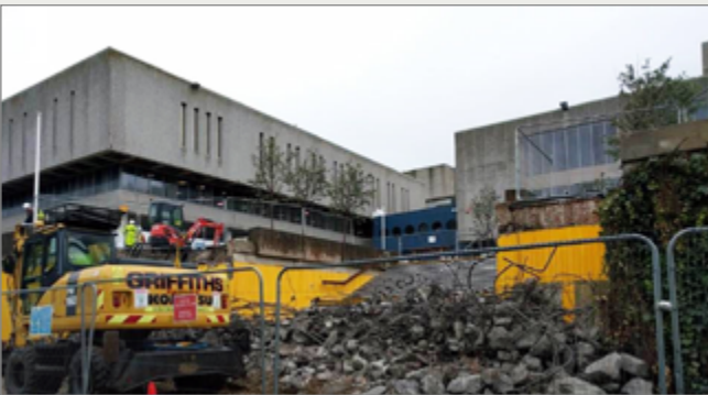
Datgymalu pont Piazza Canolfan y Celfyddydau

I gael rhagor o wybodaeth, gan gynnwys sut i gysylltu â ni, ewch i'n gwefan: www.aber.ac.uk/cy/estates/