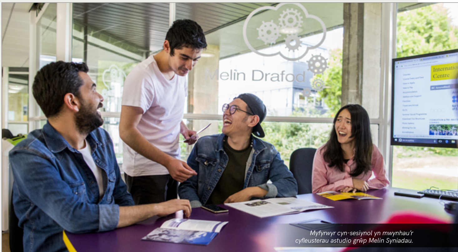
Myfyrwyr cyn-sesiynol yn mwynhau'r cyfleusterau astudio grŵp Melin Sniadau.

www.aber.ac.uk/cy/student-learning-support