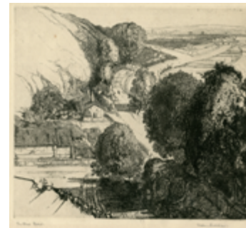
'Cwningen Ddu', Graham Sutherland. © Ystad Graham Sutherland

Printiau, lluniau, paentiadau a ffotograffau o Gasgliad yr Ysgol Gelf