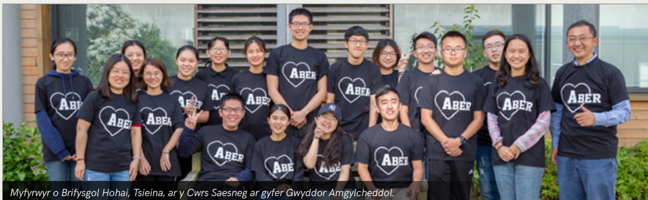
Myfyrwr o Brifysgol Hohai, Tsieina, ar y Cwrs Saesneg ar gyfer Gwyddor Amgylcheddol.

Ymunodd grwpiau o brifysgolion yn Tsieina, Siapan a Korea â theithwyr annibynnol o amrywiol wledydd yn Ewrop i fwynhau cwrs yn y Ganolfan sydd ag agwedd greadigol at ddysgu iaith ac sy'n cynnig rhaglen