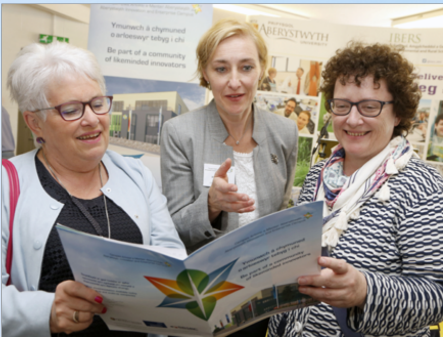
Y Cyngorydd Ellen ap Gwynn, Arweinydd Cyngor Sir Ceredigion, Elin Jones, AS, Llywydd Cynulliad Cenedlaethol Cymru, a Rhian Hayward, yn lansiad y gymuned fusnes newydd yn y Sioe Frenhinol 2017.