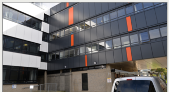
Pont a sbardun Cledwyn ar ôl gosod y deunydd inswleiddio, gosod ffenestri gwydr dwbl a newid arwyneb y to.

gyfocrog â ffrydiau cyllido posibl eraill. Mae'n canolbwyntio hefyd ar adnewyddu'r isadeiledd, er enghraifft gwasanaethau trydan a gwasanaethau eraill, ac ar dirluniau caled, meysydd parcio a heolydd.