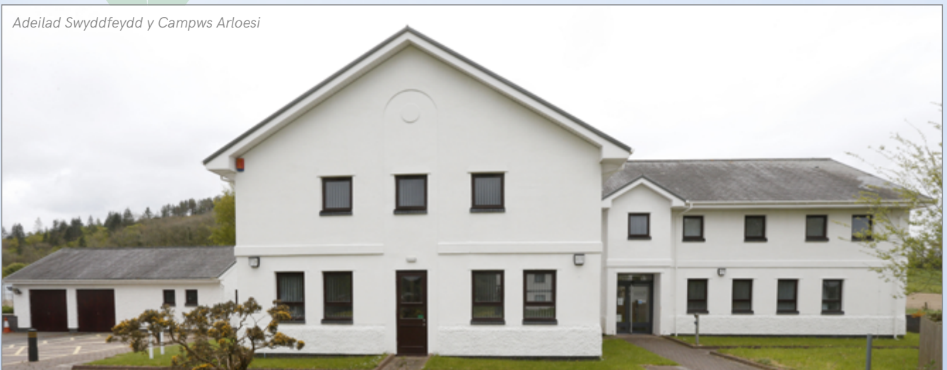
Adeilad Swyddfydd y Campws Arloesi

Yn Adeilad Swyddfydd y Campws Arloesi mae 17 o swyddfydd parod, yn amrywio o ran maint i le i un gweithiwr i le i bedwar. Mae i bob swyddfa'r gwasanaethau a'r adnoddau angenrheidiol ac maent yn ddelfrydol i gwmnïau menter a'u gweithgareddau cychwynnol/deillio, neu i fusnesau sy'n tyfu ac angen lle proffesiynol, neu fel swyddfydd allanol i gwmnïau mwy o faint a phencadlys y tu allan i'r ardal.