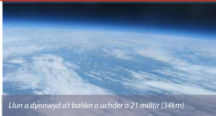
Llun a dynnwyd o'r balw'n o uchder o 21 milltir (34km)

"Yr oeddem yn olrhain ei daith yr holl ffordd i'r ddaear ond ni fedrem ddeall pam ei fod o hyd yn symud wedi iddo lanio," esboniodd Connor, "Pan gyrhaeddodd y lanfa