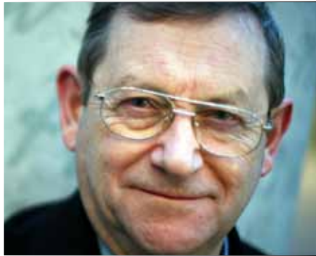
Yr Athro Norman Davies

Cynhelir Darlith Flynyddol y DDMI 2012 am 6yh ar nos lau 1af Tachwedd, yn yr Hen Neuadd, yr Hen Goleg. Bydd yr Athro Davies yn siarad ar stâd Ewrop. Mae'n addo i fod yn ddatganiad mawr gan un o haneswyr pennaf ein hoes. Am fwy o wybodaeth am ddarlithoedd cyhoeddus a digwyddiadau ewch i www.aber.ac.uk/cy/news/public-lectures-and-events/