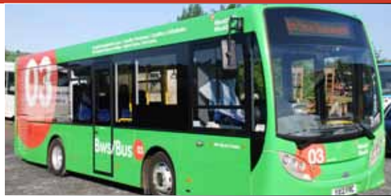
Yn barod i fynd, y bws 03 newydd.

Mae gwasanaeth bws newydd a fydd yn cysylltu'r dref, y Brifysgol a'r Llyfrgell Genedlaethol wedi cael ei lansio'n barod ar gyfer y flwyddyn academiaidd newydd.