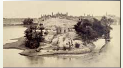
Llun o ddinas hynafol Sukkur a dynnwyd yn 1860, a leolir yn Nyffryn yr Indus, lleoliad gwareiddiad hynafol yr Harappa.

Darganfu'r ymchwilyr weddillion daearegol yr afon sanctaidd Hindwaidd chwedlonol Sarasvati yn yr anialwch sy'n amgylchynu'r dyffryn Ghaggar-Harka modern. Ni chyflenwir yr afon hon gan allyrion yr Himalaya, fel y rhagdybid, ond gan fonswn blyneddol, ac wrth i'r hinsawdd newid ni fedrai'r glaw gwannach gynnal yr afon, ac felly, mi ddiflannodd.