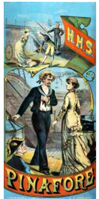
Poster cynnar yn hysbysebu HMS Pinafore. Torrwyd y ddeuwad 'goll' cyn noson agoriadol yr operetta.